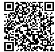
奈良市買い物支援HP