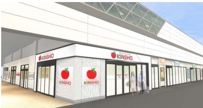
【店舗外観イメージ】